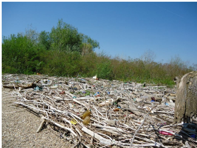
Ecosistemul din Ostrovul Calinovăț profund afectat de scăderea nivelului Dunării

Alături de eterna poluare transfrontalieră cu deșeuri miniere de la iazul de decantare Tăușan - Boșneag aparținând SC Moldomin Moldova Nouă, care își așteaptă sentința din partea Curții Europene de Justiție într-un proces în care Uniunea Europeană a acționat în instanță Statul Român pentru refuzul de a stopa poluarea, în Clisura de Sus a Dunării a mai apărut în acest an un caz grav de agresiune împotriva mediului.