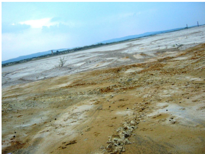
Depozitul de deșeuri miniere - Tăușani Boșneag, o sursă permanentă de poluare pentru locuitorii din Clisura Dunării.

Reprezentanții Grupul Ecologic de Colaborare Nera și ai Municipality Veliko Gradište au realizat în data de 4 mai a.c. o evaluare a stării mediului de-a lungul Dunării, pe sectorul aferent județului Caraș - Severin și a Comunei Veliko Gradište din Serbia.