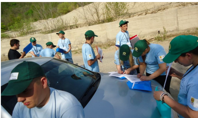
Monitorizarea stării mediului la halda de deșeuri miniere de la Sasca Montană

Telef +4 255 572026, Mobil +4 722 437197, Fax. +4 255 572026, e-mail: gecnera@yahoo.com, https://www.facebook.com/GECNERA sau partenerul Liceul Tehnologic MIHAI NOVAC ORAVIȚA pe e-mail radu_bompa@yahoo.com.