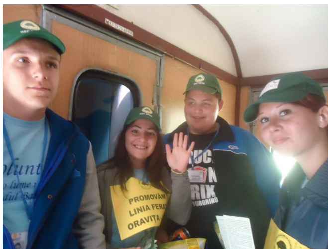
Promovarea ecoturismului pe linia ferată Oravița Anina

GEC Nera organizează în fiecare an, în perioada sezonului turistic mai - octombrie, activități de promovare a ecoturismului în zona parcurilor și rezervațiilor naturale din sudul Banatului.